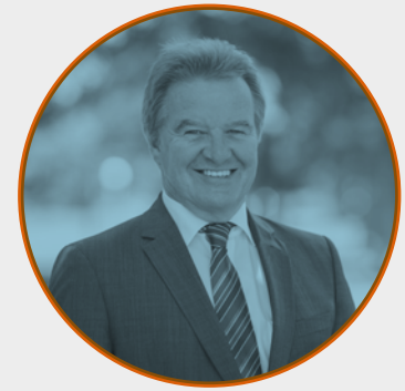
Franz Untersteller MdB Minister für Umwelt, Klima und Energiewirtschaft Baden-Württemberg

Mit interaktiven Ausstellungselementen gelingt der spielerische Einstieg in die Sanierung der eigenen vier Wände. Kurze Filme über erfolgreiche Sanierungen aus Baden-Württemberg regen zum Nachahmen an, neutrale Broschüren zu allen Sanierungsthemen vertiefen die ersten Eindrücke nachhaltig. Auch die kleinen Gäste gehen nicht mit leeren Händen nach Hause.